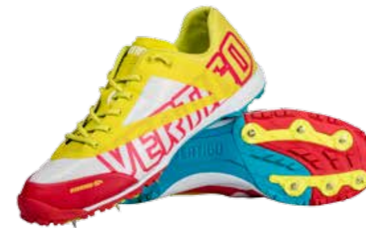
GH277 VÄRI: Lime/punainen LESTI: Kapeampi lesti, ensisijaisesti naisille ja junioripelaajille KOOT: 2-8 UK