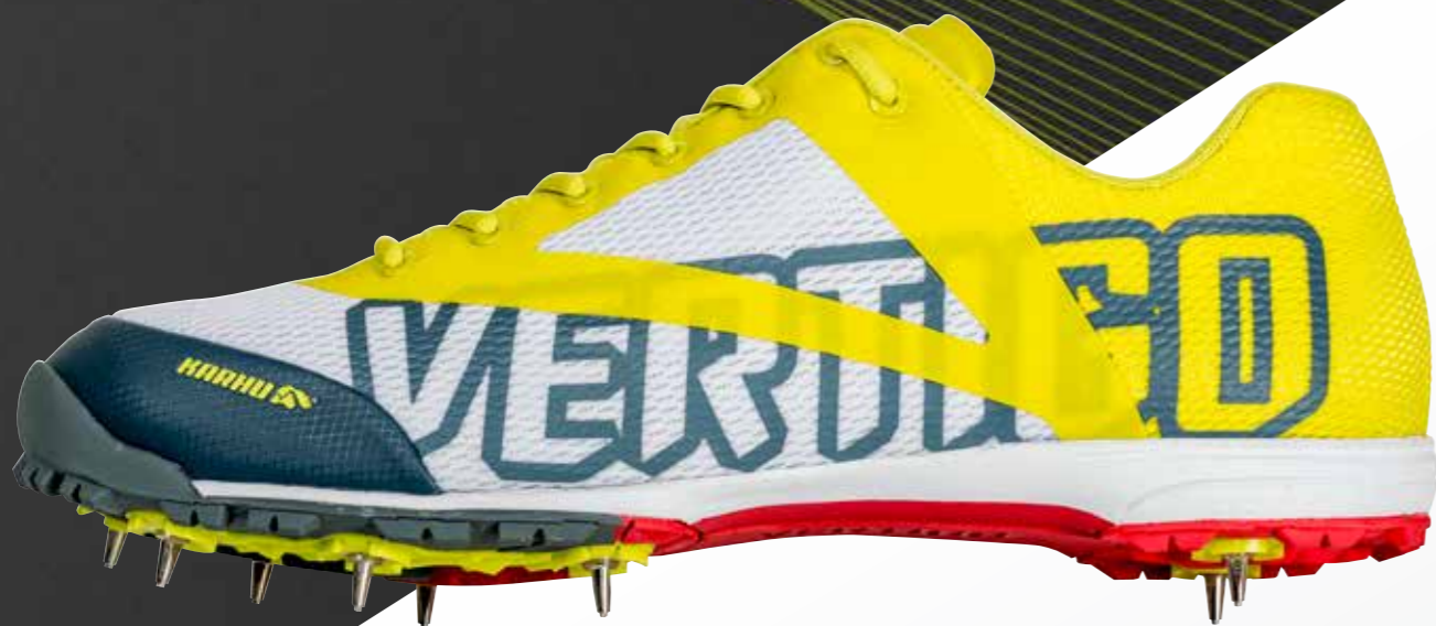
GH276 VÄRI: Lime/turkoosi LESTI: Normaali lesti KOOT: 5-13 UK

Tyylikäs design ja piikkarin kevyt rakenne viimeistelevät kokonaisuuden.